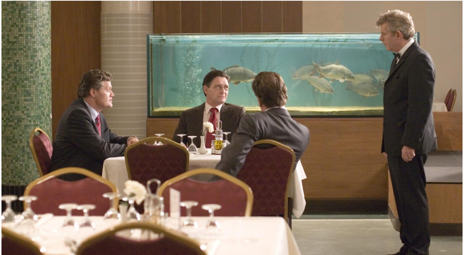
LOW | OBER, Alex van Warmerdam, 2006